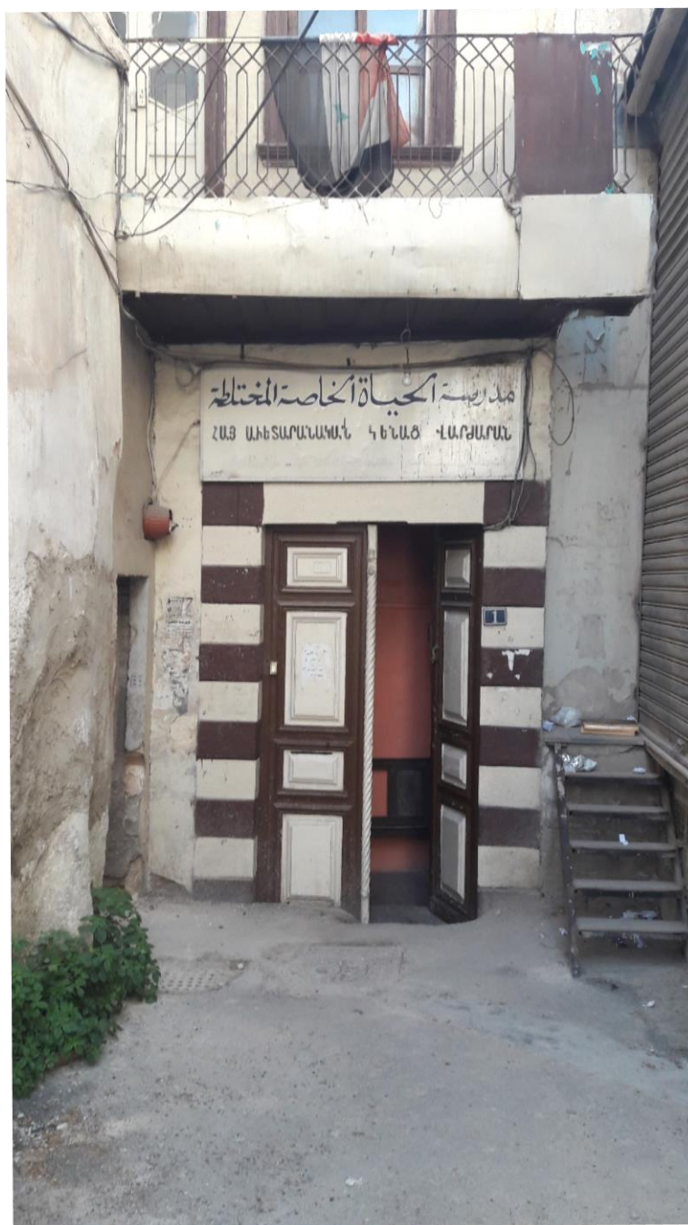
Az intézmény bejárata a történelmi belvárosban

Damaszkusz történelmi belvárosában található intézményt egy közös udvarral rendelkező polgári lakóházakból alakították ki.