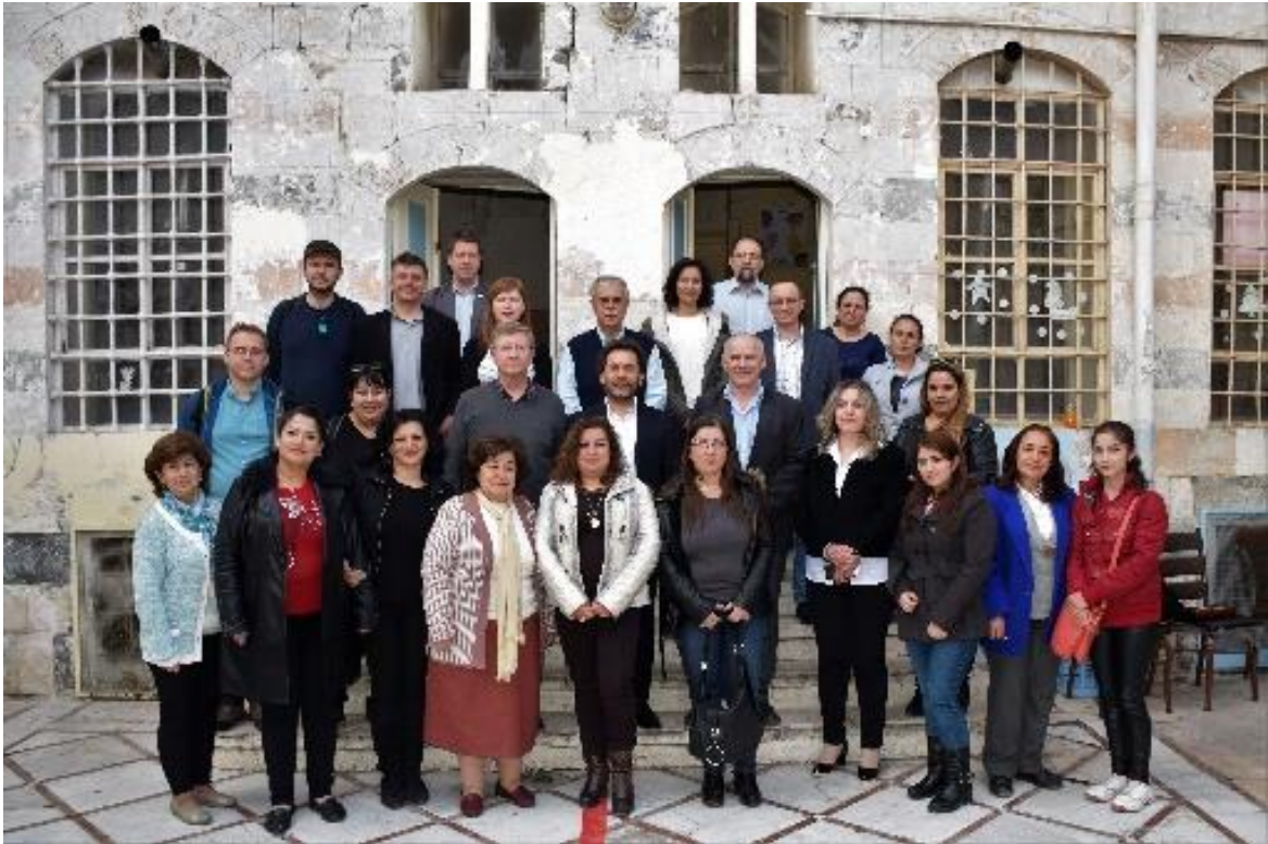
Az iskola Nevelőtestülete (első sorban) és a MRE küldöttsége