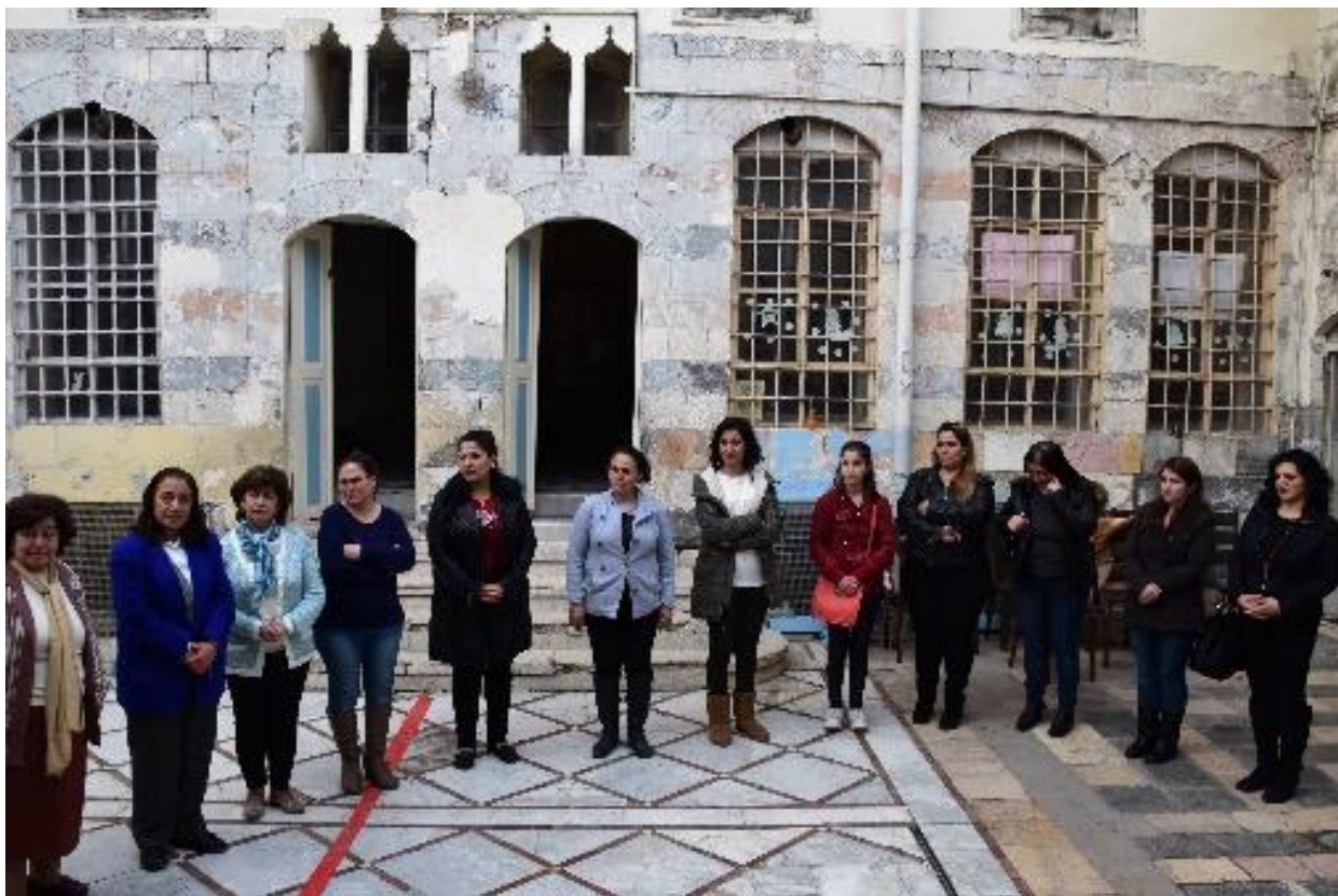
Az intézmény Nevelőtestülete (A látogatás a délutáni órákban történt, tanulók már nem voltak az intézményben)