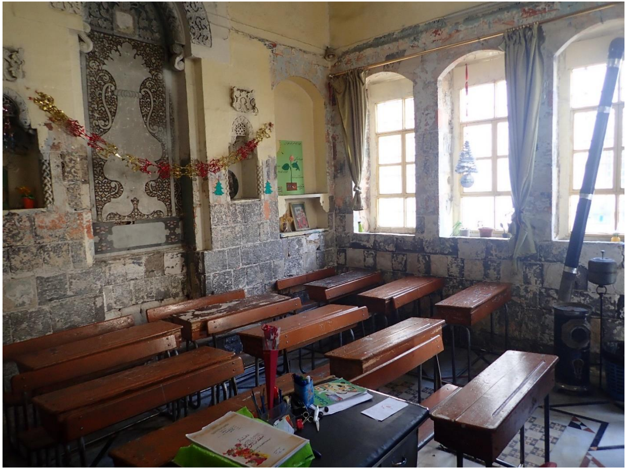
Osztályterem az ablak előtt a fűtésre szolgáló egyszerű olajkályhával.