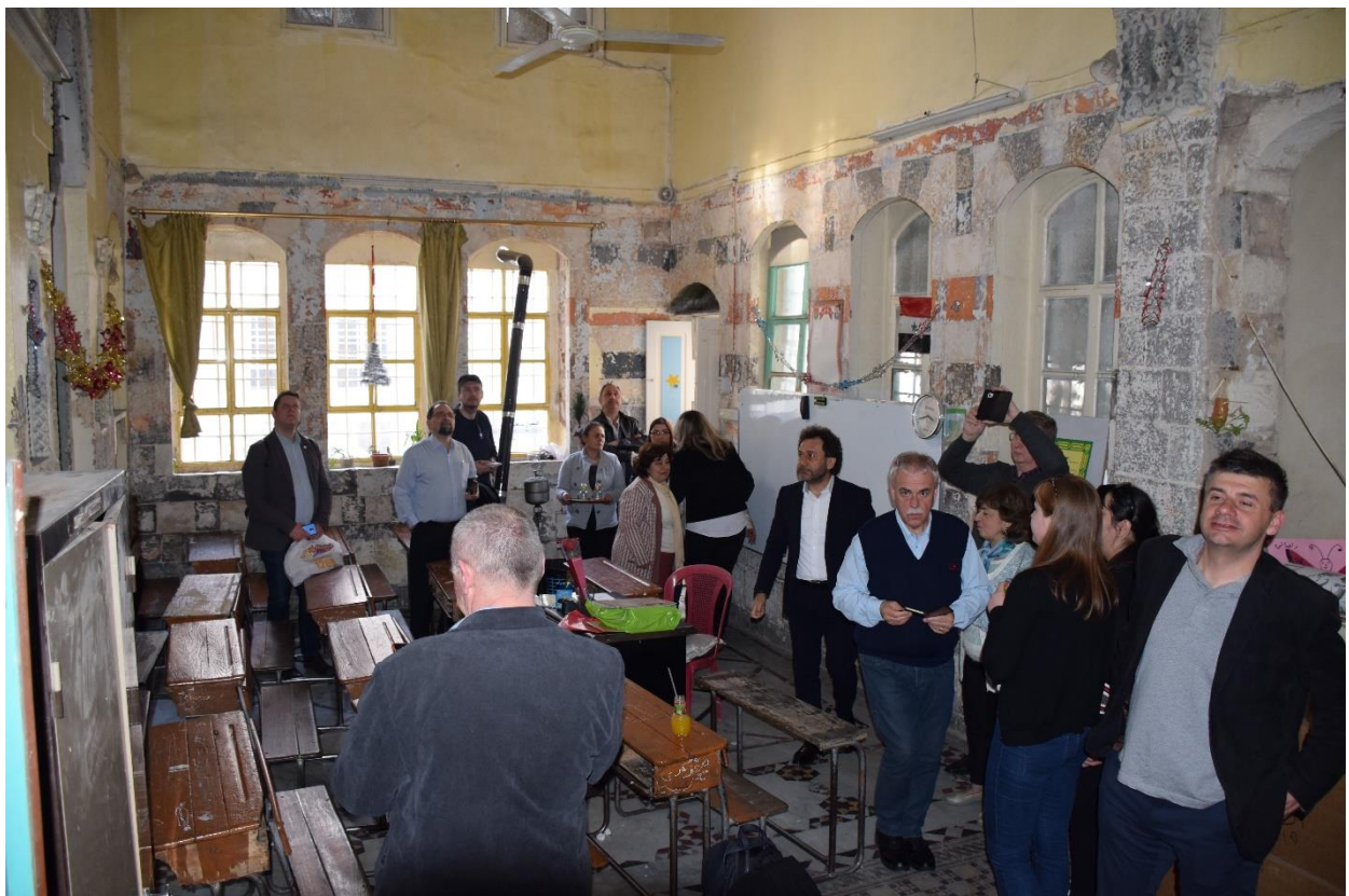
A küldöttség az osztályteremben