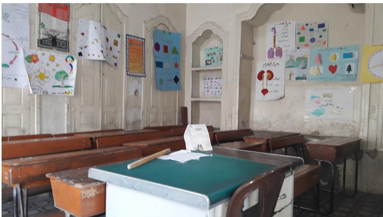
Osztályterem egyszerű berendezésekkel